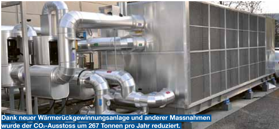
Dank neuer Wärmerückgewinnungsanlage und anderer Massnahmen wurde der CO 2 -Ausstoss um 267 Tonnen pro Jahr reduziert.

Wie Wärmerückgewinnung zu einer markant gesteigerten Energieeffizienz führt